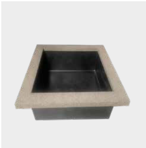
Vijver met oplegrand Rots Bassins avec bord en Rocher Teich mit Kante auf Fels