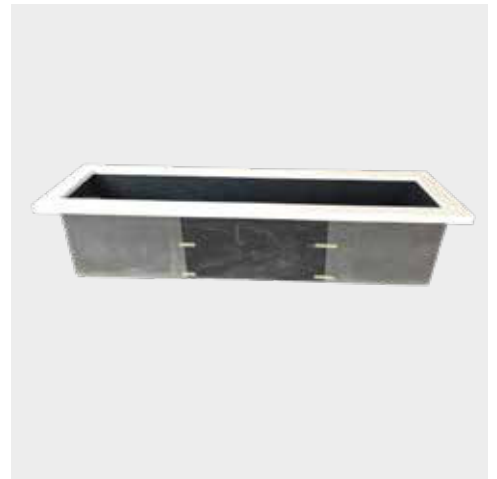
Vijver met oplegrand Wit Bassins avec bord en blanc Teich mit Kante Weiß