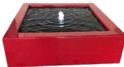
Watertafel in RAL Table d'eau en RAL Wassertisch RAL