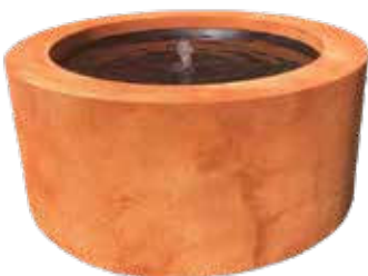
Watertafel rond in Corten Table d'eau ronde en Corten Wassertisch rund auf Corten

Verkrijgbaar in wit, zwart, cortenstaal-look, rots-look, en RAL. | Disponible en blanc, noir, corten, rock, et RAL. | Vefüigbar in weiß, schwarz, Corten, Rock, und RAL.