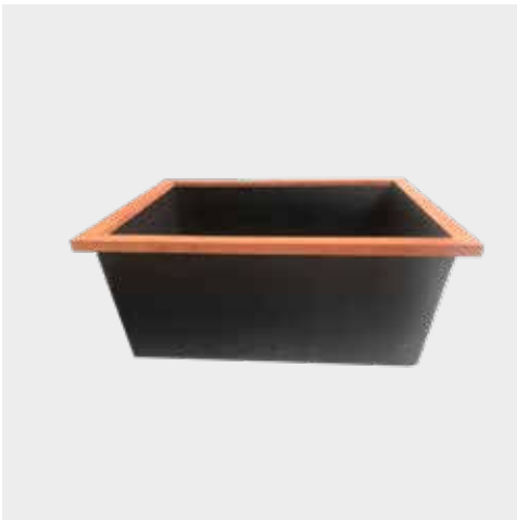
Vijver met oplegrand Corten Bassins avec bord en Corton Teich mit Kante auf Corten