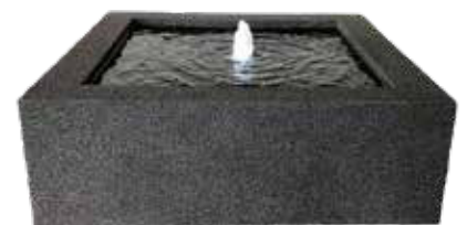
Watertafel in rots Table d'eau en Rocher Wassertisch auf Fels